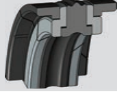
A403 Kapak Keçesi